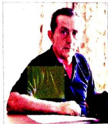
A John Fante è dedicato il Festival letterario Il Dio di mio padre.

questo primo giallo scopre chi ha ucciso un che in Riviera cercava di rinverdire l'umore raccattati qua e là. Piccolo gioco letterario: il Berté per rilassarsi scrive racconti, che entrano nel libro con vita propria, stampati in diverse