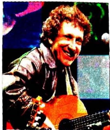
Eugenio Bennato canterà ad Ancona.